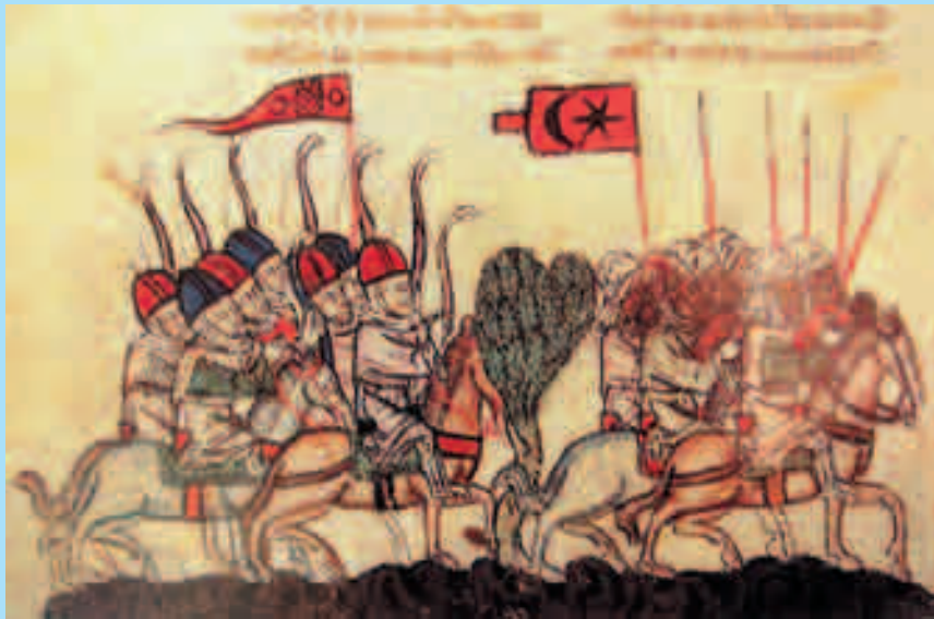
Миниатюра победы монголов Кубулай-хана над мамелюками, над войсками знамена со звездами Давида у обеих сторон, 1299 год

Борджигинов. Эту Золотую династию основал Бодончар, сын Господа нашего Иисуса Христа Златоуста и монгольской ханши Алан, которая была по происхождению Кумиром из тюркской династии кумиров. Иисус Христос Златоуст посетил окрестности Байкала в 1040-х годах, где и познакомился с Алан.