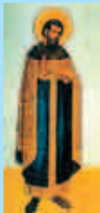
Икона Василия III Ивановича