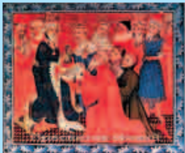
Изображение Кубулай-хана — Пресвитера Иоанна