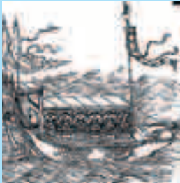
Изображение корабля Кубулай-хана