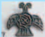
Несторианская христианская свастика в двуглавом орле