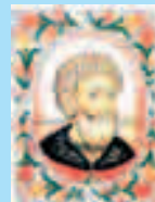
Портрет Ивана III из Титулярника