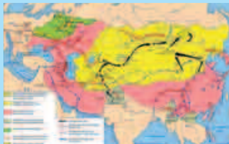
Карта завоеваний Чингисхана

оказала серьезного сопротивления монголам. Затем они захватили Кавказ и Крым. В 1223 году монголы вторглись в пределы Руси, где на реке Калке 31 мая состоялась первая битва с войсками половцев и русских князей. Часть русского войска, которая самостоятельно пыталась победить монголов, была разгромлена. Затем монголы были отозваны Чингисханом