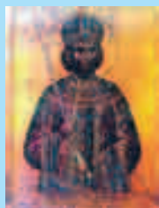
Икона последнего византийского императора Константина XI Драгаша

Василий III Иванович (25.03.1479 – 4.12.1533) стал Великим князем Московским в 1505 – 1533 годах [469] . Первый его брак был бесплоден, во второй раз он женился в 1526 году, на Елене Глинской, литовской княжне. Елена родила первенца только 25 августа 1530 года, его назвали Иваном, затем родился второй сын – Юрий. Трудности в появлении потомства показали, что Василий III был поставлен Великим князем не от Бога, его слабое здоровье было лучшим тому подтверждением. Нарушение законов династии дорого обошлось Руси впоследствии. Василий умер 3 декабря 1533 года от заражения крови, вызванного нарывом на левом бедре.