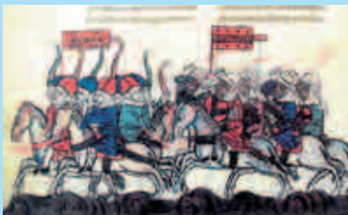
Миниатюра победы мамелюков над монголами, над войсками знамена со звездами Давида у монголов, 1281 год

Пятый Великий хан Монгольской империи Пресвитер Иоанн был похоронен рядом со своим дедом Чингисханом в специальном районе погребения ханов — в Бурхан Хадуне. Точное место до сих пор не известно. Предполагают, что это горы Хенти.