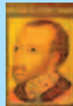
Портрет Федора I Ивановича из Титулярника

Так Русь варягов и византийских императоров в XVI веке канула в Лету из-за утверждения на престоле государства ложного человека, осуществившего геноцид династии Кумиров. Реальные претенденты на царство и императорство были физически уничтожены изувером Иваном Грозным. Практически все рода, которые хоть что-то помнили о прошлом и имели хоть малейшие властные амбиции, были казнены и разорены под предлогом надуманной измены. Вместо того чтобы посадить на престол России наиболее образованного, здорового и знатного человека, бояре и духовенство отдали власть шизофренику и преступнику. Самыми достойными претендентами на царство были князья Кубенские и Курбские. Эта истори-