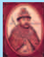
Портрет Бориса Годунова из Титулярника