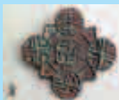
Несторианская христианская свастика в кресте

Камбоджи и Бирмы. Кубулай в захваченных странах и городах проводил «интересную» селекцию пленных. Оставлял в живых христиан, артистов, художников и ремесленников — он был покровителем искусств, ремесел и торговли. При нем наступила золотая эпоха китайской живописи и театра, юаньская драма стала важным элементом китайской литературы.