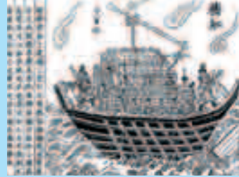
Изображение корабля Кубулай-хана

Одним из направлений экспансии империи Пресвитера Иоанна стала Япония. Интересны «официальные» подробности причин вторжения монгольских войск в Страну восходящего солнца. По официальной версии, монгольский хан прискакал на маленькой лошадке на берег Тихого океана и спросил китайских чиновников: «А что там, за этой водяной степью? Нет ли там тучных пастбищ для наших выносливых лошадок?» Китайцы ответили: «Там бедная стра-