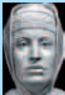
Фото реконструкции лица Софьи Палеолог

на низком уровне. Первый раз он женился на Анастасии Захарьиной-Юрьевой, которая родила ему трех детей — Дмитрия, умершего в младенчестве, Ивана и Федора. Второй его женой была княжна Мария Темрюкова, третьей — Марфа Собакина, умершая через три недели после свадьбы. Затем он женился на Анне Колтовской, постриженной в монахини, потом — на Анне Васильчиковой, умершей через четыре года после свадьбы, шестой была Василиса Мелентьева, последней — Мария Нагая. Она родила болезненного царевича Дмитрия, погибшего в 1591 году в Угличе.