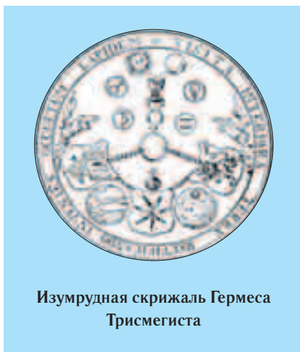
Изумрудная скрижаль Гермеса Трисмегиста

И все это только для того, чтобы свершить чудо одного-единственного.