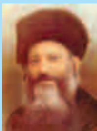
Кук, Авраам Ицхак, каббалист, XX век

носителем вселенского знания и генов праотца всех землян. Каббала повлияла на ход мировой истории, превратив многие страны в территории, фактически оккупированные мировыми сионистской и франкмасонской элитами. В их число входят Россия, Украина, Польша и США. Носителями каббалы и проводниками этой власти являются представители еврейской и иных национальностей, изучающие каббалу и принимающие ее как свою религию.