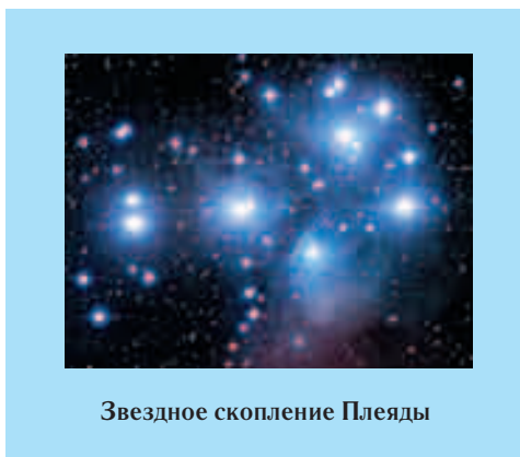
Звездное скопление Плеяды

Электра (др. греч. Ηλέκτρα) — возлюбленная Зевса, родившая ему трех детей: Дардана, основателя Троянского царства и родоначальника династии Дарданидов, Язиона и Гармонию, супругу Кадма (возможно, это Адам), основателя Фив. Легенды об Электре привязаны к острову Самофракия, получившему название «острова Электры», где, по преданию, Зевс вступил в связь с Электрой.